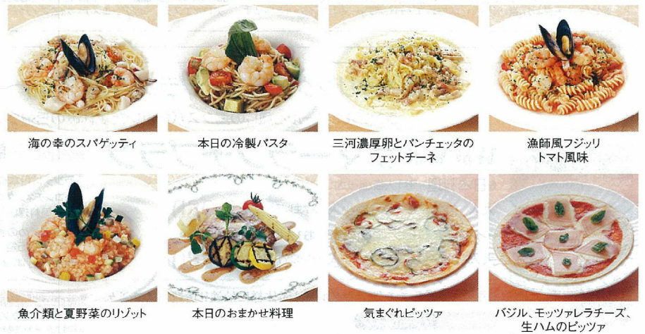
海の幸のスパゲッティ